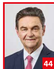
Klaus Herzog, Oberbürgermeister a.D.